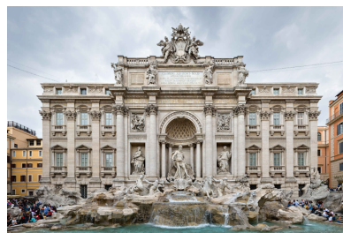
Roma / Rim: Palača / Palazzo Poli

Giovedì, 22 settembre 2016 alle ore 17,00 verrà inaugurata a Roma , presso la prestigiosa sede di Palazzo Poli (Fontana di Trevi) la mostra “Pietro Nobile. Viaggio artistico in Istria” .