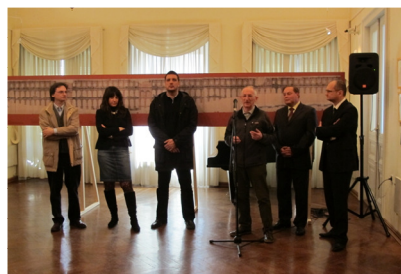
Otvoritev / Inaugurazione (Krmac, Ujčić, Komšo, Župančič, Crnković, Bradanović)

Info: www.histriaweb.eu mail: histria@histriaweb.eu tel.: +386 (0) 30 244062