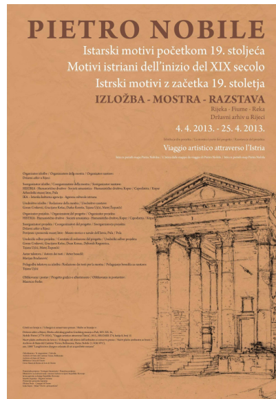
Razglas / Locandina

Partnerji projekta / Partner del progetto: Arheološki muzej Istre, Pula Istarska kulturna agencija - Agenzia culturale istriana Državni arhiv u Rijeci Povijesni i pomorski muzej Istre - Museo storico e navale dell'Istria, Pula / Pola