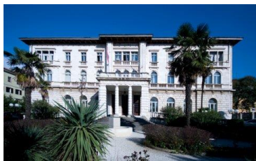
DHB - Marine - Kasino