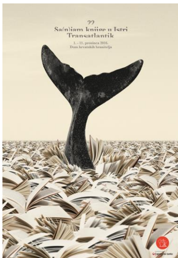
Plakat / Locandina