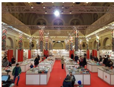
Glavni salon / Sala centrale