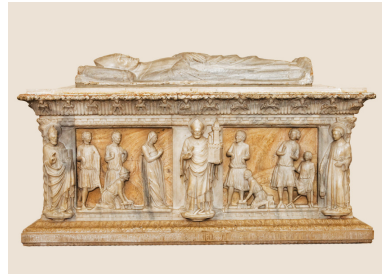
Sarkofag Sv. Nazarija / Arca di San Nazario