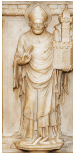
Sv. Nazarij / San Nazario