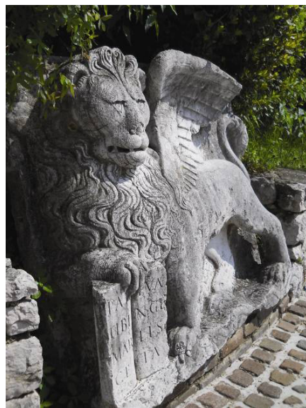
Trsat / Tersatto