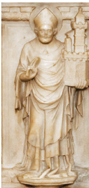
Sarkofag sv. Nazarija, detajl / Sarcofago di San Nazario, particolare